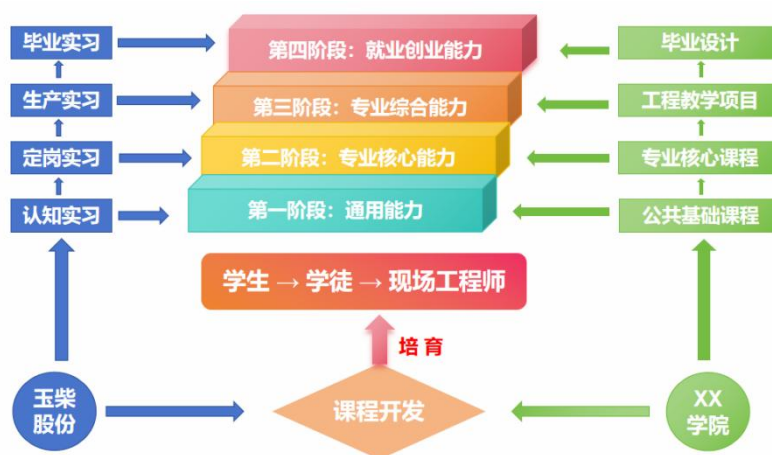
图 2 工业机器人（玉柴现场工程师班）人才培养模式

对照当今智能装备技术领域人才需求能力要求，按照悉尼协议范式结合人才培养目标设置课程体系和内容。在专业建设中与企业深度合作建设 OBE 课程，以工程引领理念按照工程项目理念设计工程项目课程。通过专家座谈、集体研讨、问卷调查等方式，分析核心职业岗位——工业机器人操作、工业机器人编程、工业机器人系统集成、工业机器人维保、工业机器人销售、机电设备安装维修与调试等的任职要求和工作任务，分析、序化完成工作任务所需的能力、知识、素质要求，归纳典型工作任务，按照从简单到复杂、从单一到综合的教育教学规律，构建专业主干课程。